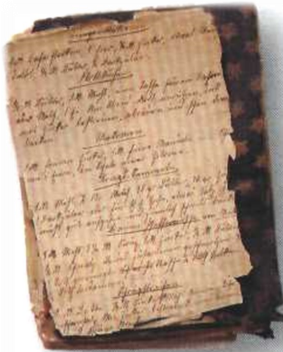
Страница рукописной кулинарной книги.

Профессиональные повара впервые появились при дворах, а зате́м уже — в монастырских трапезных.